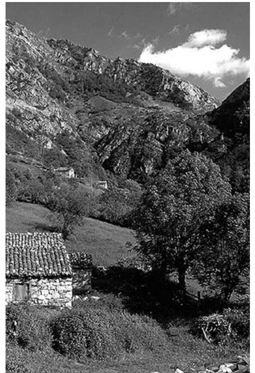
Puerto de San Isidro

Hay cuestiones, como la estación de esquí proyectada por el Ayuntamiento para la vertien-